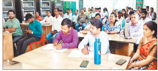
बैठक में शामिल विज्ञान सहायक।